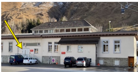
Cucina Macolina mit Parkmöglichkeiten

Die Versammlung findet in den Räumlichkeiten der Cucina Macolina statt. Die Zufahrt erfolgt über die Schranke, welche von uns per Knopfdruck geöffnet wird. Eine detaillierte Wegbeschreibung finden Sie auf unserer Website ( www.waldundklima.ch/gv26 )